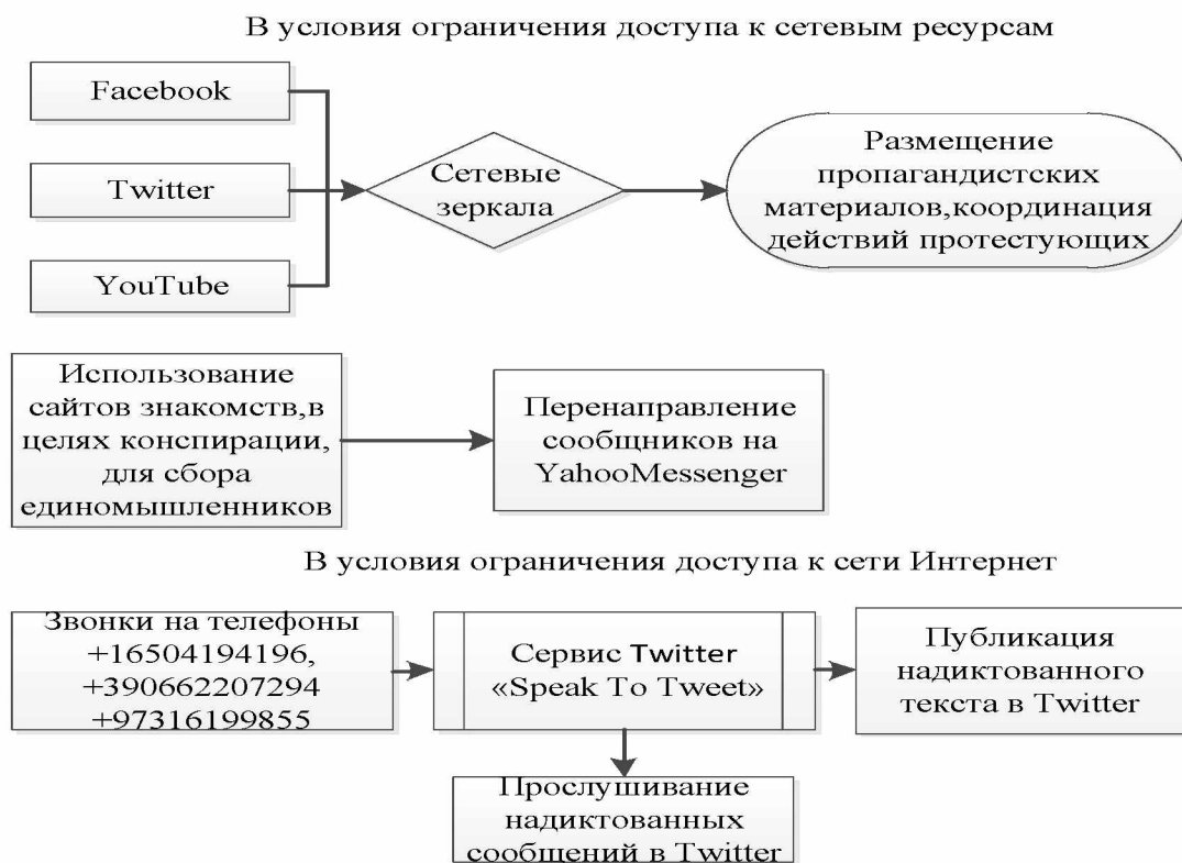
Рисунок 1. Обобщённая схема использования социальных сетей при организации массовых протестов в Северной Африке