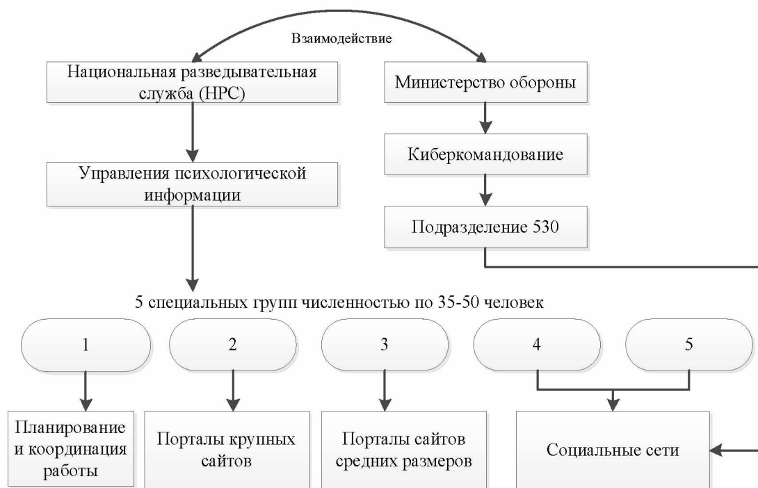
Рисунок 2. Обобщённая схема работы структур госбезопасности Южной Кореи по манипулированию общественным мнением.

В целях конспирации деятельность специальных групп велась в интернет-кафе